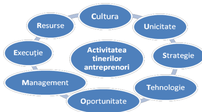
Figura 2.16. Modelul CUSTOMER